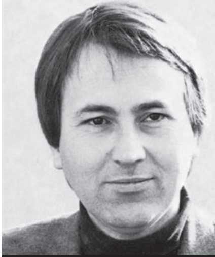
Frieder Bernius um 1980

lange Zeit einzig genannten Werken, wie z. B. dem Oktett oder der Ouvertüre zum Sommernachtstraum , nicht zugleich ebenso bedeutende Vokalmusik geschrieben haben? Eine eingehendere Auseinandersetzung mit dem geistlichen Vokalwerk Mendelssohns wurde allerdings immer wieder durch die zu einseitige Würdigung seiner Verdienste um die Wiederaufführung der Bach'schen Matthäus-Passion oder durch Vorurteile, die seine jüdische Herkunft betrafen, überlagert.